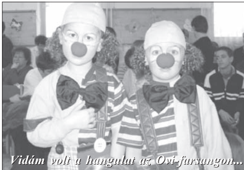
Vidám volt a hangulat az Ovi-farsangon...